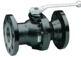
DN 65-100 ▲