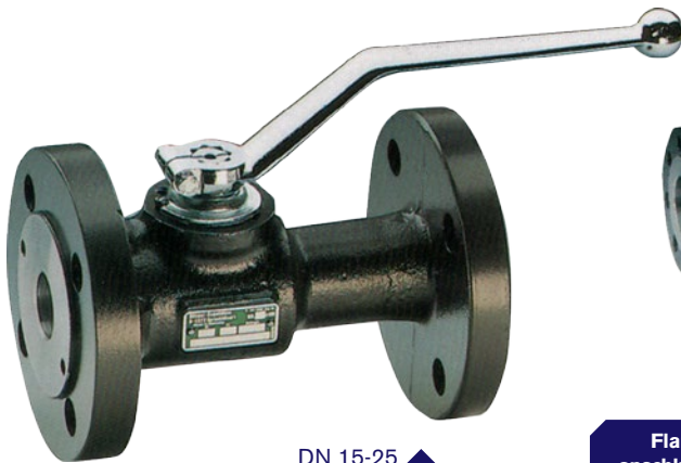
DN 15-25 ▲